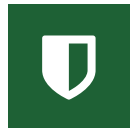
Facsys Secure Storage