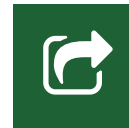
Facsys Scanstation Pro

COLLABORA, COMUNICA, GESTISCI RISORSE DIGITALI E INVIA FAX SEMPRE E DOVUNQUE